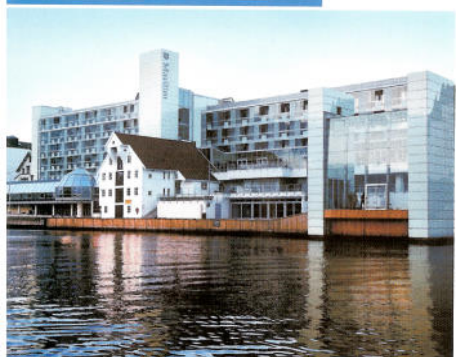
Rica Maritim Hotel

Vi setter stor pris på våre sponsorer av mandagskvelden: